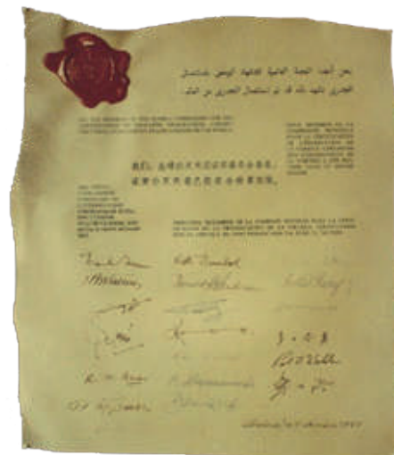
Pergamena ufficiale dell'eradicazione del vaiolo.

Per dirla con l'Ecclesiaste, «quel che è stato sarà e quel che è fatto si rifarà; non c'è niente di nuovo sotto il sole».